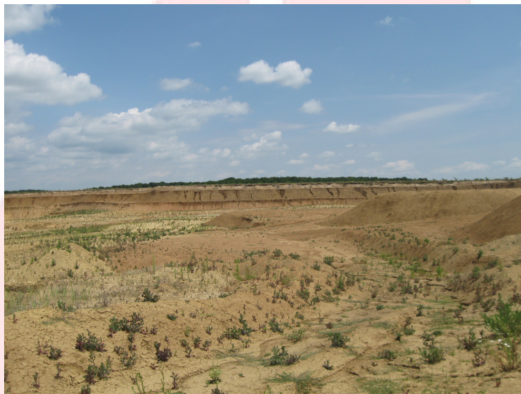
# Cariera de argila / halda de argila

Materia prima principala este reprezentata de argila, provenita din cariera proprie. Argila destinata procesului tehnologic este haldata spre macerare (proces de „imbatranire” al argilei), in zona de depozitare a materiilor prime. Intr-o prezentare foarte simpla procesul tehnologic este definit astfel: